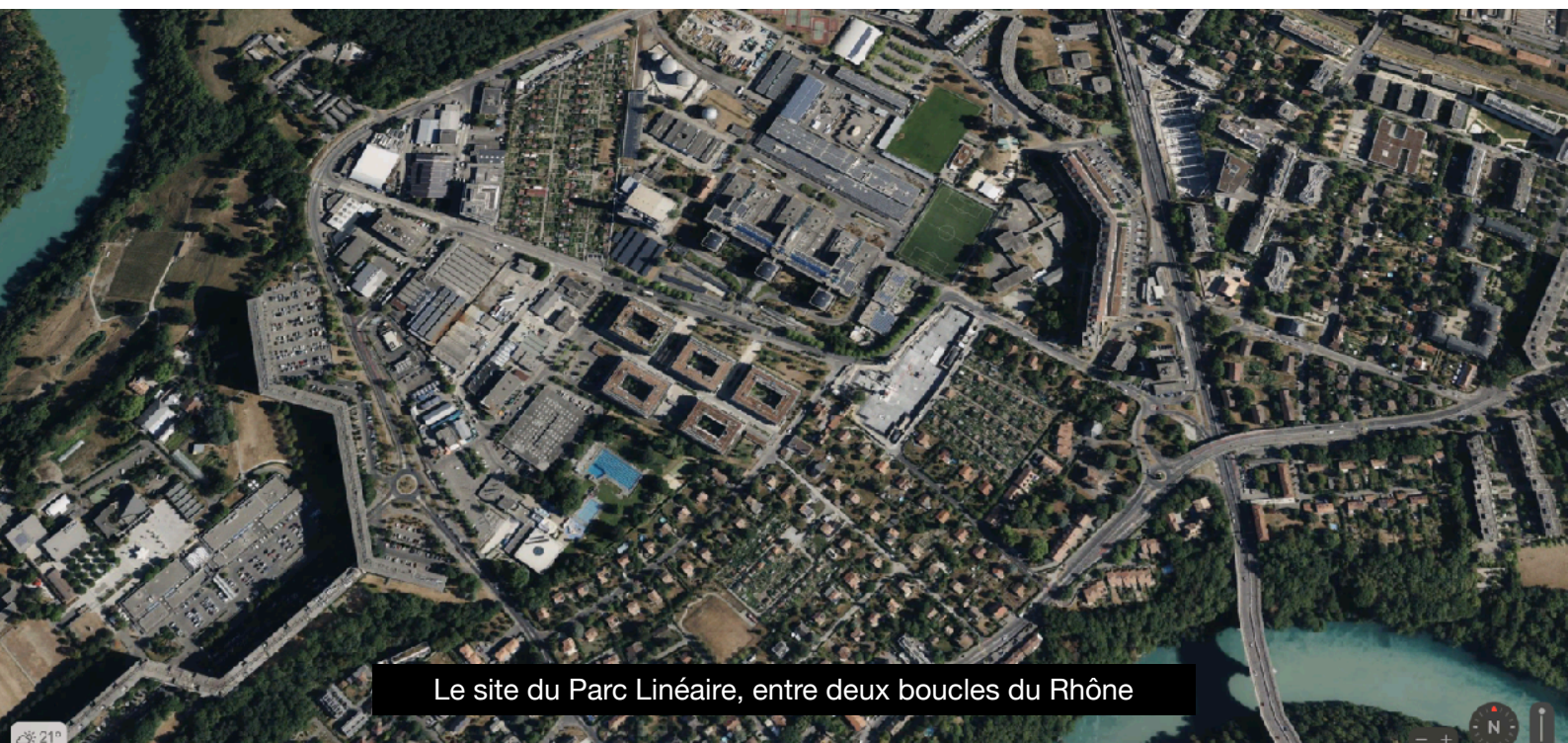
Le site du Parc Linéaire, entre deux boucles du Rhône

Merci aux participants d'accepter le partage de cet échange dans le cadre du projet TEST.